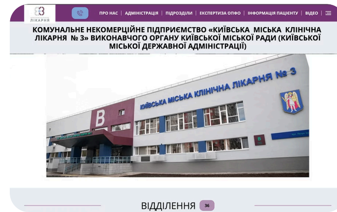
КНП «Київська міська клінічна лікарня №3»